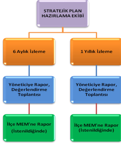
Şekil1: İzleme ve Değerlendirme Süreci